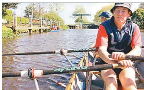
Ausfahrt ins Moor: Die Wassersportler waren unterwegs auf der Hamme.

Weitere Auskünfte zum Abfall-ABC erteilt Tobias Bruns vom Landkreis Oldenburg unter der Telefonnummer 04431/85-343.