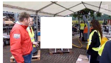
Informationstag bei der Firma Dynapac