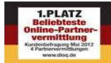
Finde deinen Traumpartner