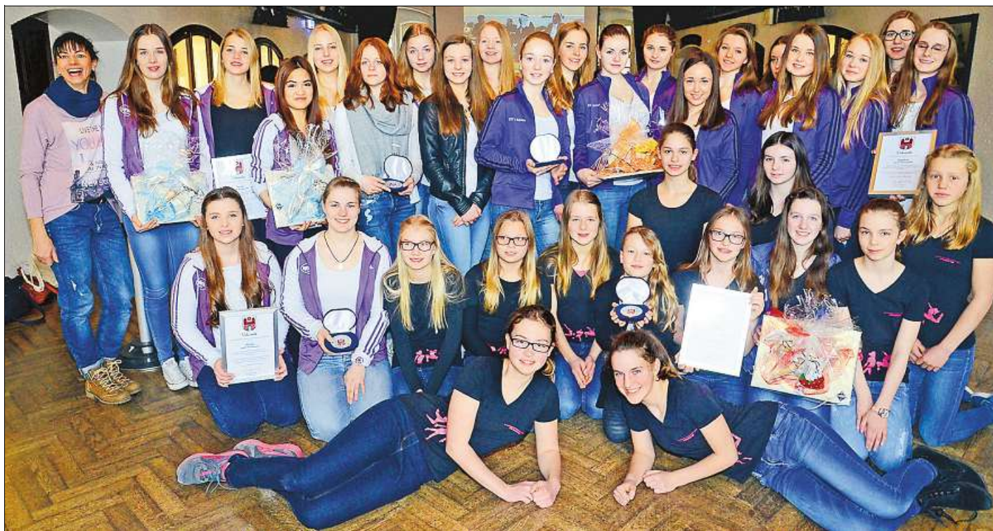
Erfolgreiche Sportlinnen: Die Gruppen „Jancapi“, „Sonadora“ und „Movido“ vom SC Wildeshausen waren auf Landes- und Bundesebene erfolgreich. Dafür gab es nun Urkunden und städtische Medaillen.

AUSZEICHNUNG Bürgermeister ehrt jesidische Initiative und SC Wildeshausen